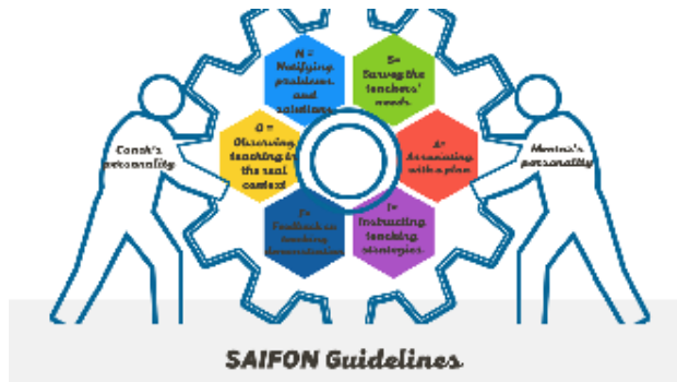
ภาพที่ 2 SAIFON Guidelines

การอภิปรายผลในการศึกษาคั้งนี้แสดงเป็นภาพที่ 2 ได้ดังนี้